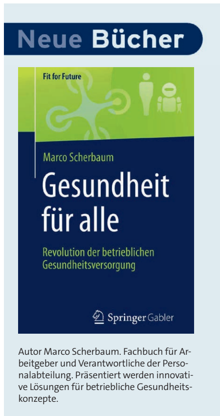
Autor Marco Scherbaum. Fachbuch für Arbeitgeber und Verantwortliche der Personalabteilung. Präsentiert werden innovative Lösungen für betriebliche Gesundheitskonzepte.

Monat. Ich habe dazu festgestellt, dass die betriebliche Krankenversicherung zweckgebunden zur Verbesserung des allgemeinen Gesundheitszustandes eingerichtet wurde und habe eine Gleichbehandlung mit der seit dem 1. Januar 2008 eingeführten steuerlich unterstützten Gesundheitsförderung